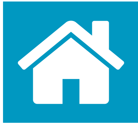
Bouwen en wonen