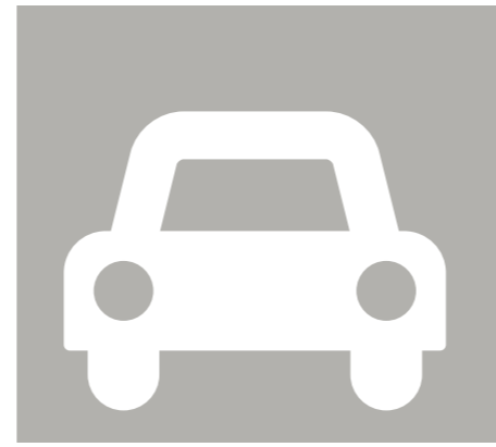
Verkeer en parkeren

Verbod op loslopende honden (aanpassen APV).